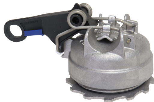
DERVAFIX2N7.5 - 8.5