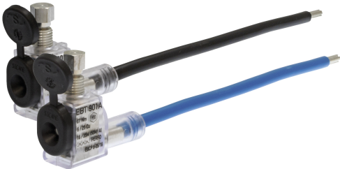
EBT 901 T2A

Version 2300 : Liaison constituée de deux connecteurs à perforation d'isolant.